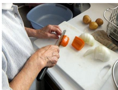
生活機能訓練を兼ねた料理