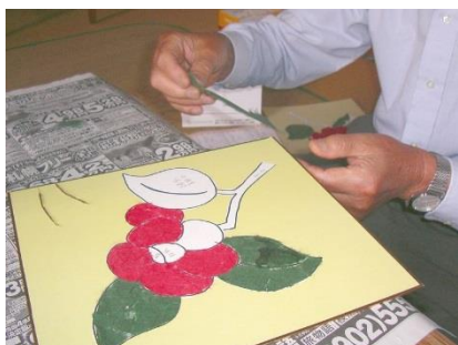
脳活性化につながる作業活動

重点を置き、住み慣れた地域で生活していくお手伝いをさせていただきます。通常1回60分で週1日、6ヶ月程度を目安に行ないます。